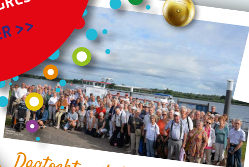
Dagtocht met de Zilvermeeuw 15 JULI 2023

"Het was heel gezellig en goed verzorgd."