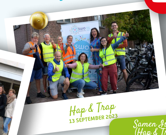
Hap & Trap 13 SEPTEMBER 2023