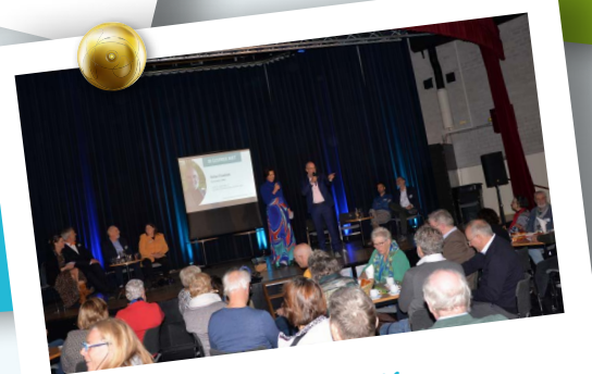
Minicongres 24 NOVEMBER 2023

"Heel fijn om met zoveel verschillende instanties samen te zijn en elkaars ervaringen te delen."