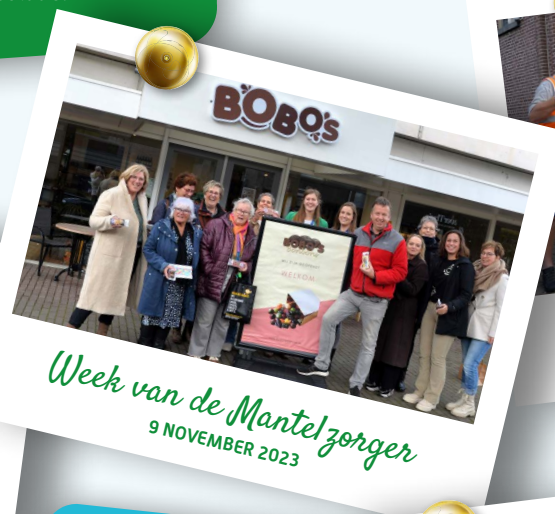
Week van de Mantelzorger 9 NOVEMBER 2023

"Ik heb even helemaal nergens anders aan gedacht, ik ben alleen leuk bezig geweest met het maken van chocolade."