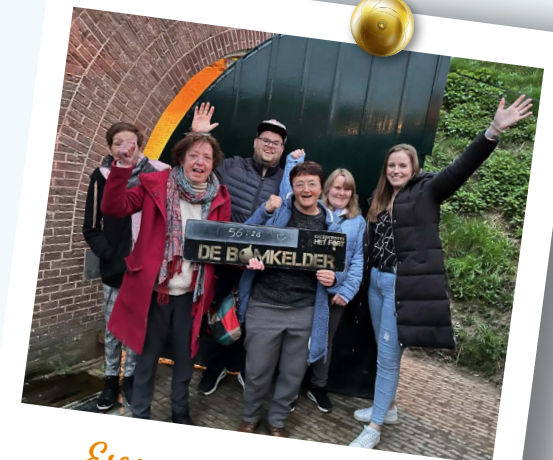
Escaperoom Fort Lunet 7 APRIL 2023

In 2023 is de werkgroep Drimmelen Verbindt op verschillende locaties in de gemeente in gesprek gegaan met inwoners over het thema eenzaamheid en het belang van sociaal contact, gekoppeld aan deelname aan activiteiten. Dit is gekoppeld aan bekendheid geven aan de activiteitengids Max Vitaal.